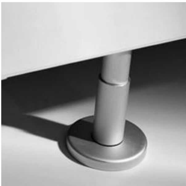
Fuß aus Aluminium oder Edelstahl, stufenlos höhenverstellbar von 80 mm – 215 mm