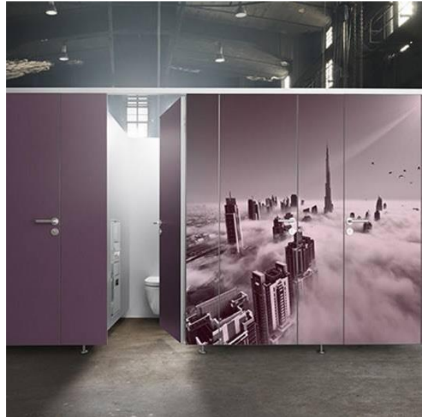
Digitaldruck: Das Trennwandsystem PRIMO F lässt sich hervorragend mit individuellen Digitaldrucken auf den Wänden und Türfronten ergänzen