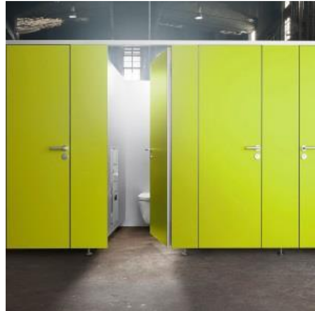
Standoptimiert: Füße in den Zwischenwänden