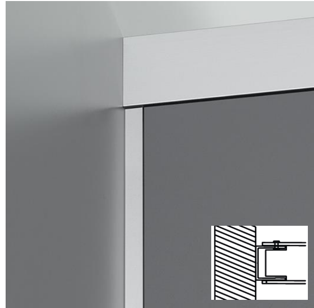
Maueranschlüsse durch Schattenfugen zum Ausgleich von Bauleranzen