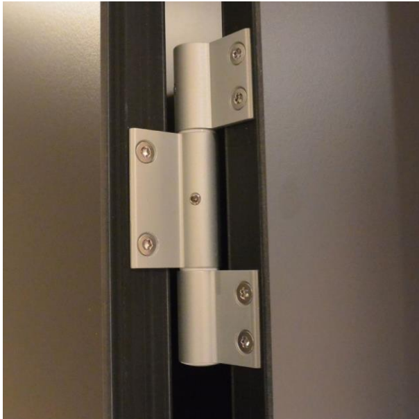
3-Rollen-Kantenband aus Aluminium mit eingebauter Feder zum Selbstschließen oder Selbstöffnen der Tür