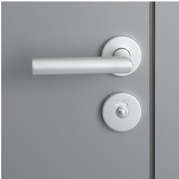
Zweiriegel-WC-Schloss mit Drücker in L-Form aus Aluminium oder Edelstahl