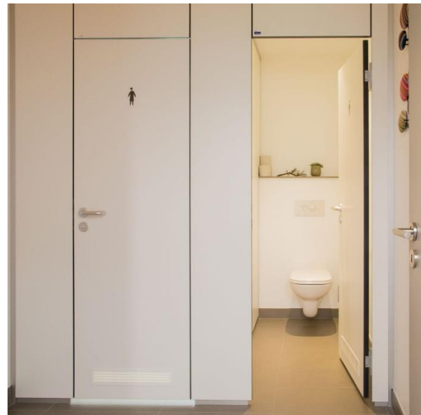
Raumhoch geschlossen: Boden- und Deckenanschlussprofile aus massivem Aluminium