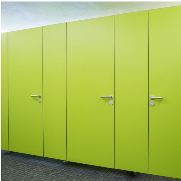
Schwebend: Füße und Stabilisator in den Zwischenwänden