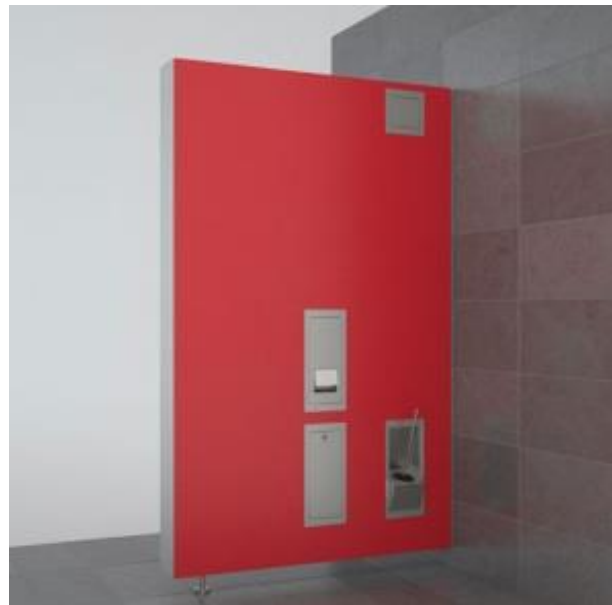
SaniQub – Die Systemwand: In die Zwischenwand (als Variante) kann das komplette Sanitärzubehör glattflächig integriert werden.