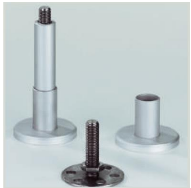
Fuß im Detail - Edelstahlkern und Edelstahlteller mit trittfester Abdeckkrosette