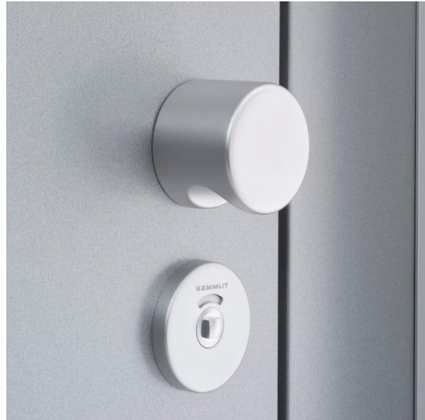
Einriegel-Schloss mit Zugknöpfen aus Nylon, Aluminium oder Edelstahl