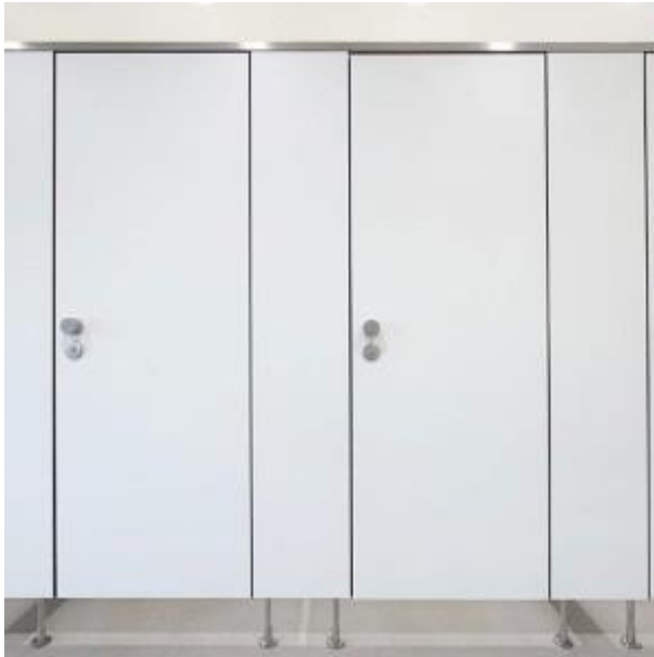
Standard: Füße und Stabilisator in der Vorderfront